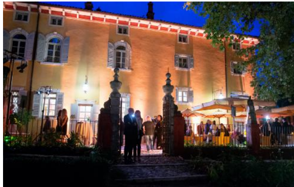
L'evento si è tenuto alla Villa Cordevigo di Cavaion